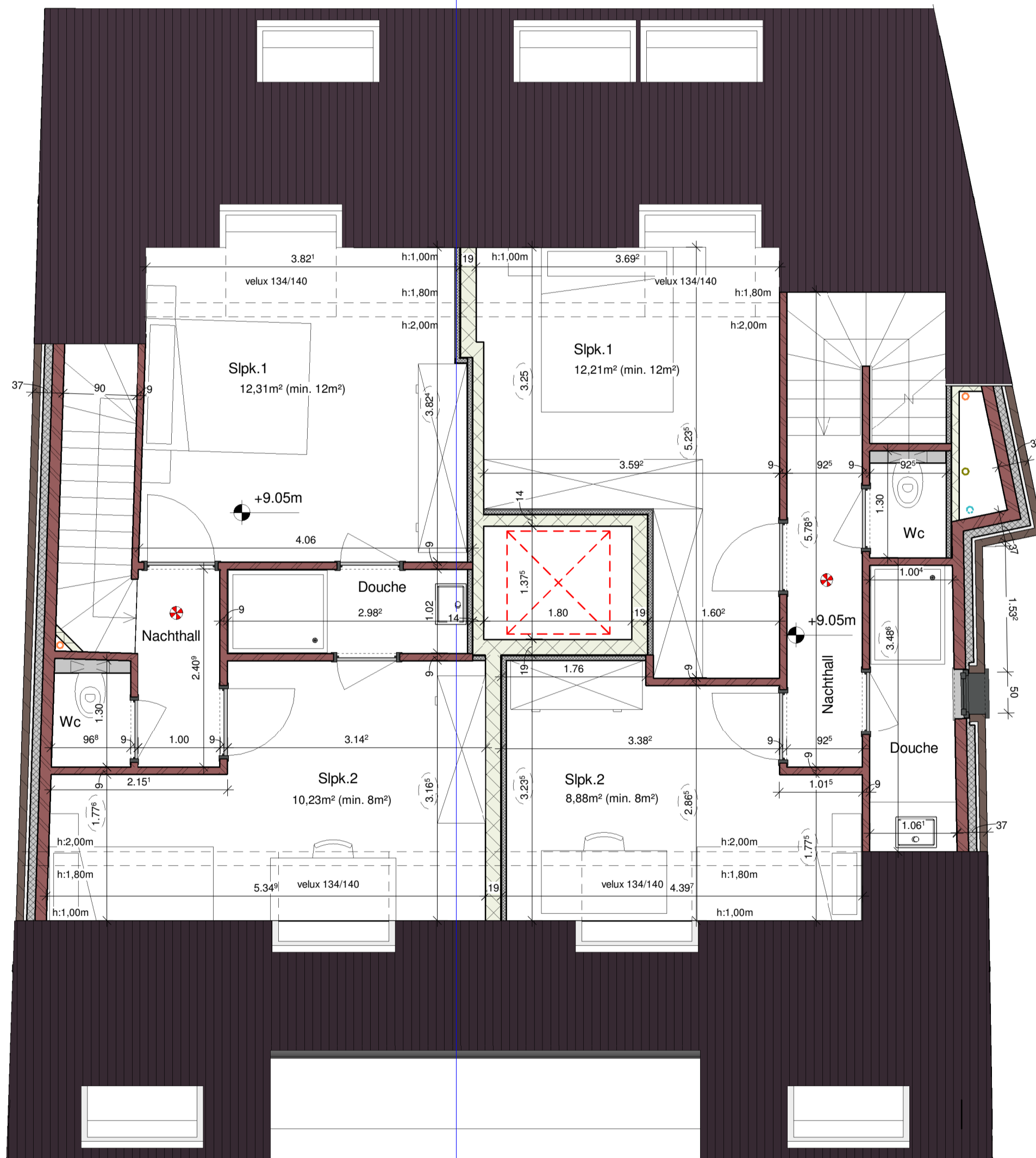
BA_Wijzigingen 2de verdieping en dakverdieping_S_N_01